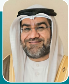
بقلم: الشيخ عبدالناصر عبدالله