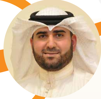
تحقيق: الأستاذ أحمد الساعي

أنواعها أمام أطفالهم، لأنها تشكل جزءاً كبيراً من شخصياتهم. فعندما يجلس الأب مع أطفاله وهم يشاهدون التلفاز ويذكر الله بصوت عال فيسمعونه ويرددون ما قاله فقد غرس غراساً حسناً، أو تجلس الأم وسط أطفالها وهم يلعبون ويمرحون وهي تقرأ القرآن فيشاهدونها ويتأثرون منها فقد غرست غراساً حسناً، أو يتعامل الأب مع من حوله بلين وابتسامة وأطفاله معه فأيضاً غرس غراساً حسناً، أو عندما تُعد الأم وجبة الإفطار ويساعدها الأب فيتعلم الأطفال التعاون والتكاتف ويغرس الغرس الحسن، أو لما يجمع الأب أفراد أسرته بعد ختم القرآن الكريم ليرددوا الدعاء بشكل جماعي فقد غرس الغراس الحسن، أو تتصدق الأم أمام أطفالها أو توفر لهم النقود وتعطيهم الحسنة ليتصدقوا بها يومياً ويتعودون على مساعدة المحتاجين والمداومة على الطاعة فقد غرست غراساً حسناً، وقس على ذلك كل قول أو فعل حسن مبارك إيجابي تعلمه لطفلك فيعمل به أو يغرس في عقله اللاواعي