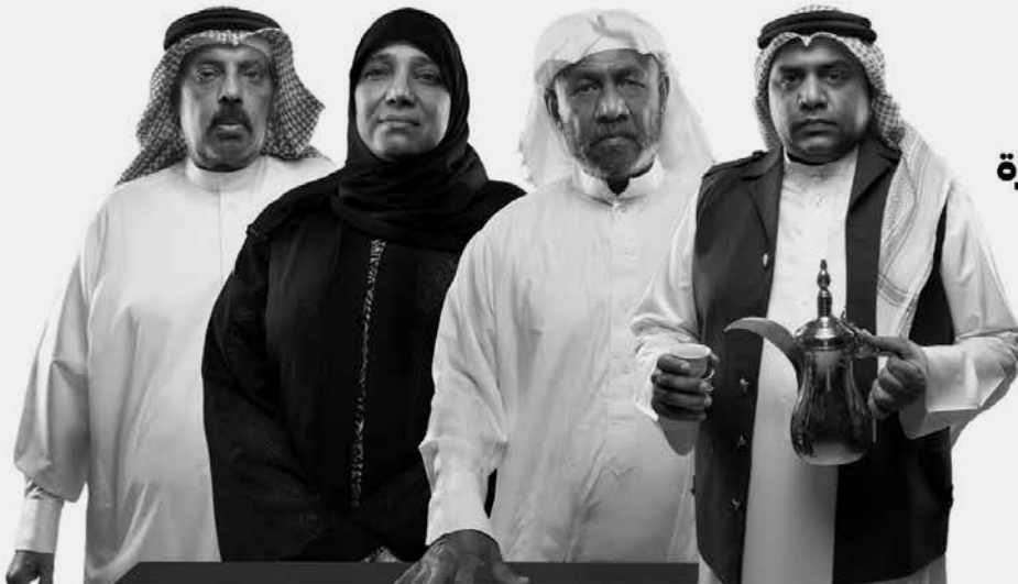
شخصيات افتراضية متضررة