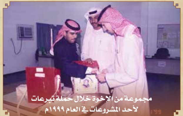
مجموعة من الاخوة خلال حملة تبرعات لأحد المشروعات في العام ١٩٩٩م