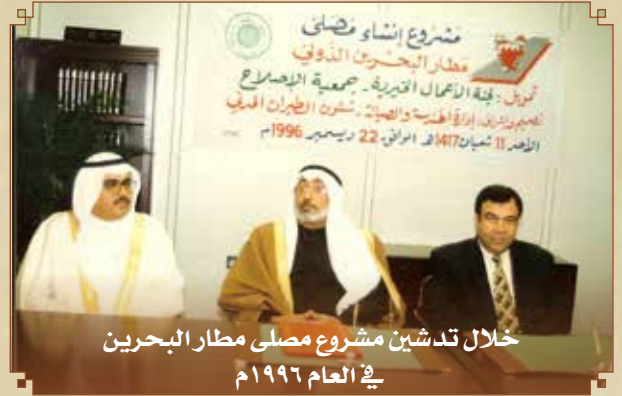
خلال تدشين مشروع مصلى مطار البحرين في العام ١٩٩٦م