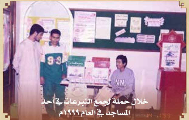
خلال حملة لجمع التبرعات في أحد المساجد في العام ١٩٩٩م