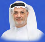
قصيدة فلتفرحي يا شام

مجلة شهرية تصدرها جمعية الإصلاح رقم التسجيل: SRAS 135 العدد 299 جمادى الآخرة 1446هـ ديسمبر 2024م