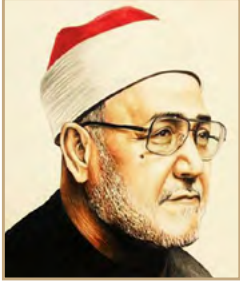
الشيخ محمد الغزالي رحمه الله