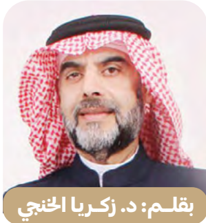
بقلم: د. زكريا الخنجي