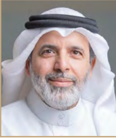
بقلم: وليد محمد الحمادي

بفصاحة رسالته لي في (الواتسب) مثلاً بحيث يكون مهتماً بالكلمات بل ويتحرى حتى سلامة الهمزات، وكَم يؤلني مَنْ يرسل رسالة يُهين فيها اللغة ويلصق حرف الفاء في الاسم ويستخدمها كحرف الجر "في" فيقول "فالبيت" مكتفياً بكسر الفاء دون إتباعه بحرف الياء ويقصد بذلك "في البيت"، ويَحَرِّف رَسْم الكلمات حتى وصل الحال ببعضهم بأن يكتب لَفْظَ الجلالة بهذي الطريقة المفجعة: "الاه"! وإذا ما ناقشته في ذلك فإنه يرد بجهله عليك وكأنك إنسان متشدد أو كمن يعيش في قرون سابقة عفا عليها الزمن. وليت الأمر يقف عند "في" المظلومة أو لفظ الجلالة المحرَّفة فالقائمة طويلة جداً من الكلمات العربية التي يُمَعِن مَنْ يُسَمُّون أنفسهم بالأعراب بتحريفها