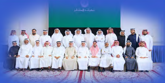
الإصلاح تعقد جمعيتها العمومية لانتخاب مجلس الإدارة للدورة 23 لعامي 2025-2026