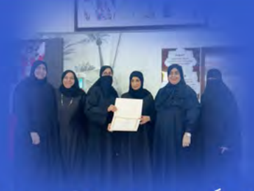
تزامناً مع يوم المرأة البحرينية إدارة العمل النسائي بفرع الحد تقيم عدة برامج وفعاليات