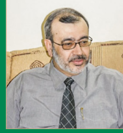
بقلم: محمود حسن جناحي