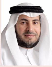
بقلم / د. علي أحمد