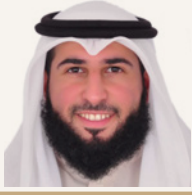
الشيخ إبراهيم طارق منصور