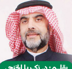
بقلم: د. زكريا الخنجي