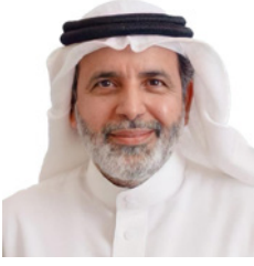
بقلم/ وليد الحمادي