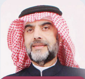
بقلم: د. زكريا الخنجي