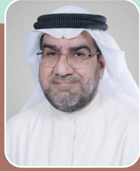
بقلم: الشيخ عبد الناصر عبد الله