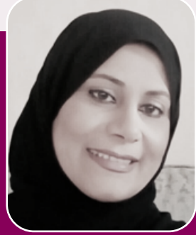
بقلم : نجاة بنت علي شويطر