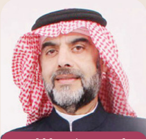
بقلم: د. زكريا الخنجي