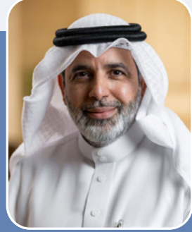
بقلم: وليد محمد الحمادي